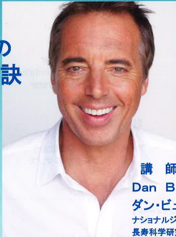
講師 Dan Buettner ダン・ビュイトナー氏 ナショナルジオグラフィック 長寿科学研究者