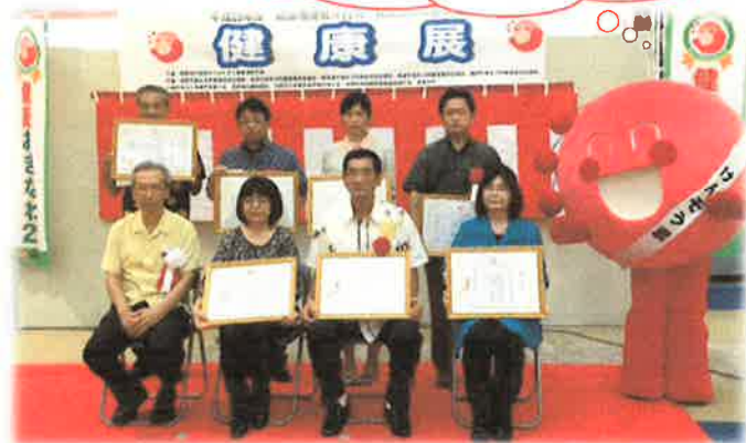
健康づくり推進表彰の様子(平成28年度)