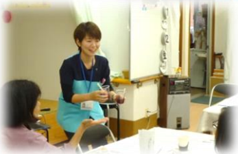
講師活動 (認知症カフェ)