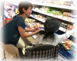
居住地域での 買い物指導