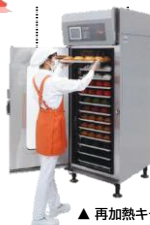
▲再加熱キャビネット